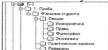
Рис. 2 Дерево папок.

Действия: откройте папку, внутри которой следует создать новую папку. Нажмите на кнопку Новая папка . Наберите имя новой папки.